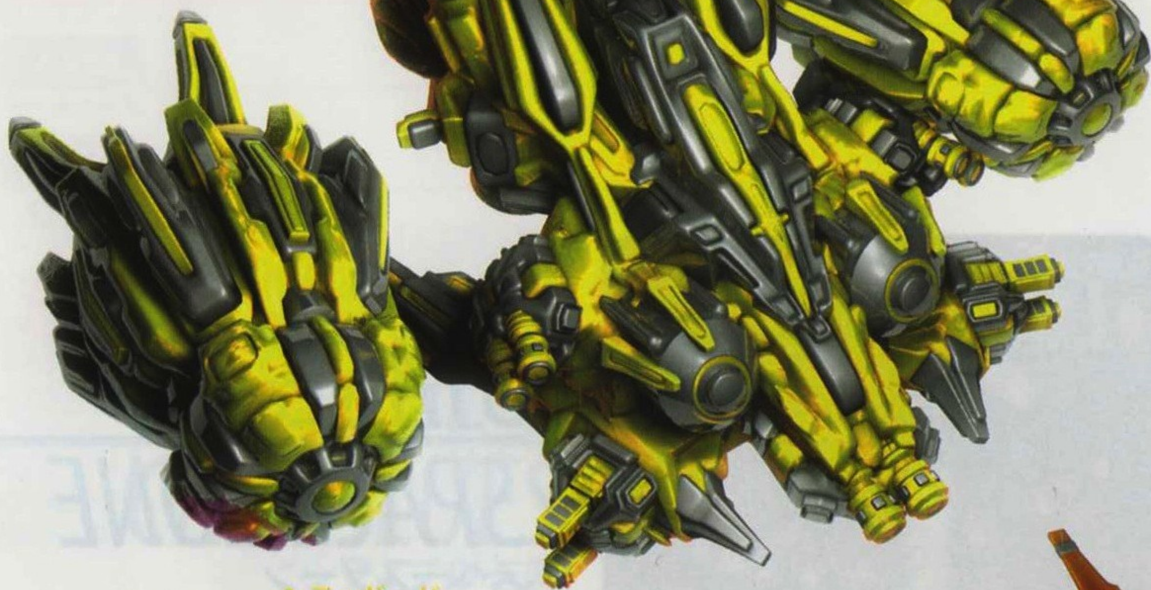
シティガード CITY GUARD